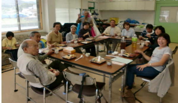
いつでもげんき支部 海南海草

10/16(土)9時30分から、組合員8名、職員5名、合計13名がげんきホールに集まって仲間増やし統一行動を行いました。2, 3人1組でチームを組んで30件訪問し、4件加入(書き替え1件含む)がありました。11月6日にバスツアーを予定しており、そのお誘いも兼ねて訪問しました。17件対話。10時から12時までみっちり行動した後、みんなでお弁当と食べながら、労をねぎらいました。バスツアーの申し込みも目標人数の半分以上を超え、もう一息です。中には数名、未組合員の初参加の方も申し込まれているようで、これを機会に、仲間も増やしたいと思います。