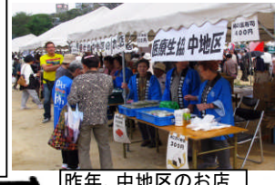
昨年、中地区のお店