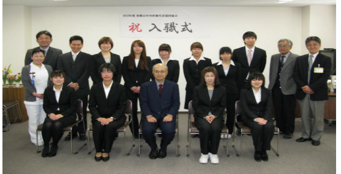
医師2名 看護師6名 理学・作業療法士3名