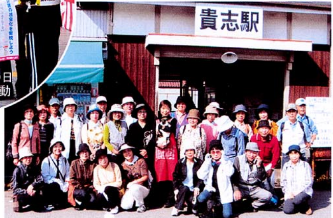
10月15日 健康づくりチャレンジウォーキング大会にたま駅長さんも参加