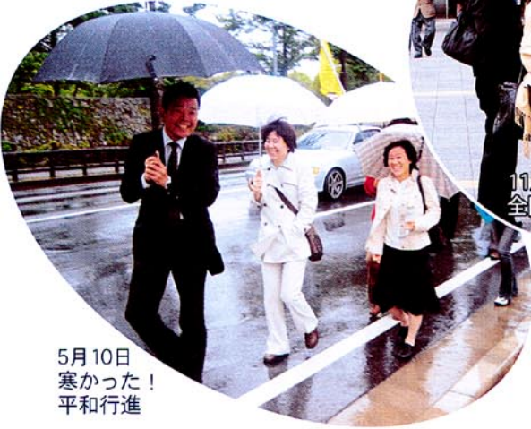
5月10日 寒かった！ 平和行進