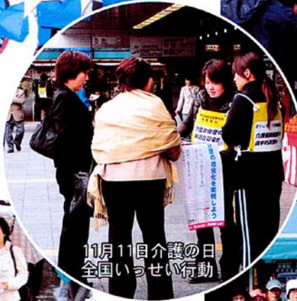
11月11日介護の日 全国いっせい行動