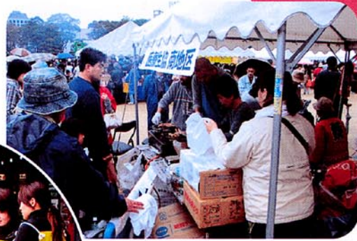
10月26日 生協まつりは 珍しく雨でした