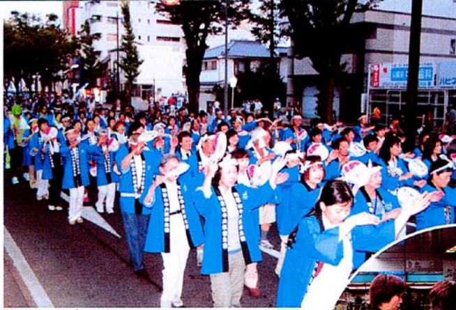
8月2日 もうベテラン！紀州おどり