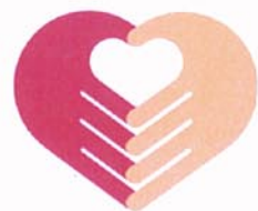
新しいマークです

和歌山中央医療生活協同組合 ☎ 073-474-5121 FAX 073-475-4288 医療生協のホームページ http://www.w-iryoseikyo.com/