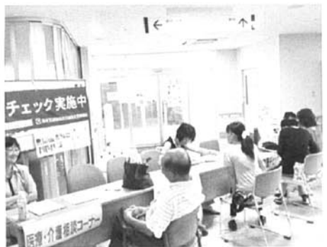
健康チェック・医療介護相談