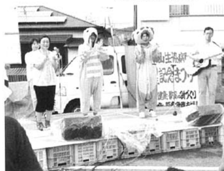
生協こども診療所