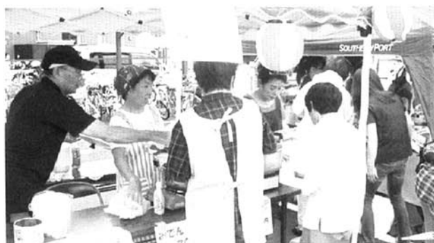
出店にもぎわって

した。発電自転車発電を体験するコーナーや「きのかわふるさと村」さんの野菜直売、「買志川線の未来をつくる会」や震災後立ち上がった「三陸鉄道を応援する会」などのお店も出ていました。地元加納の「株式会社あはなはん」のご好意で関西風お好み焼きの材料400食分をご提供いただき、売り上げを台風12号で被害を受けたみなさんに役立てていただく義援金といたしました。この日参加された2000人の方々とともに地域・組合員さんとともに歩んだ30年を祝いました。