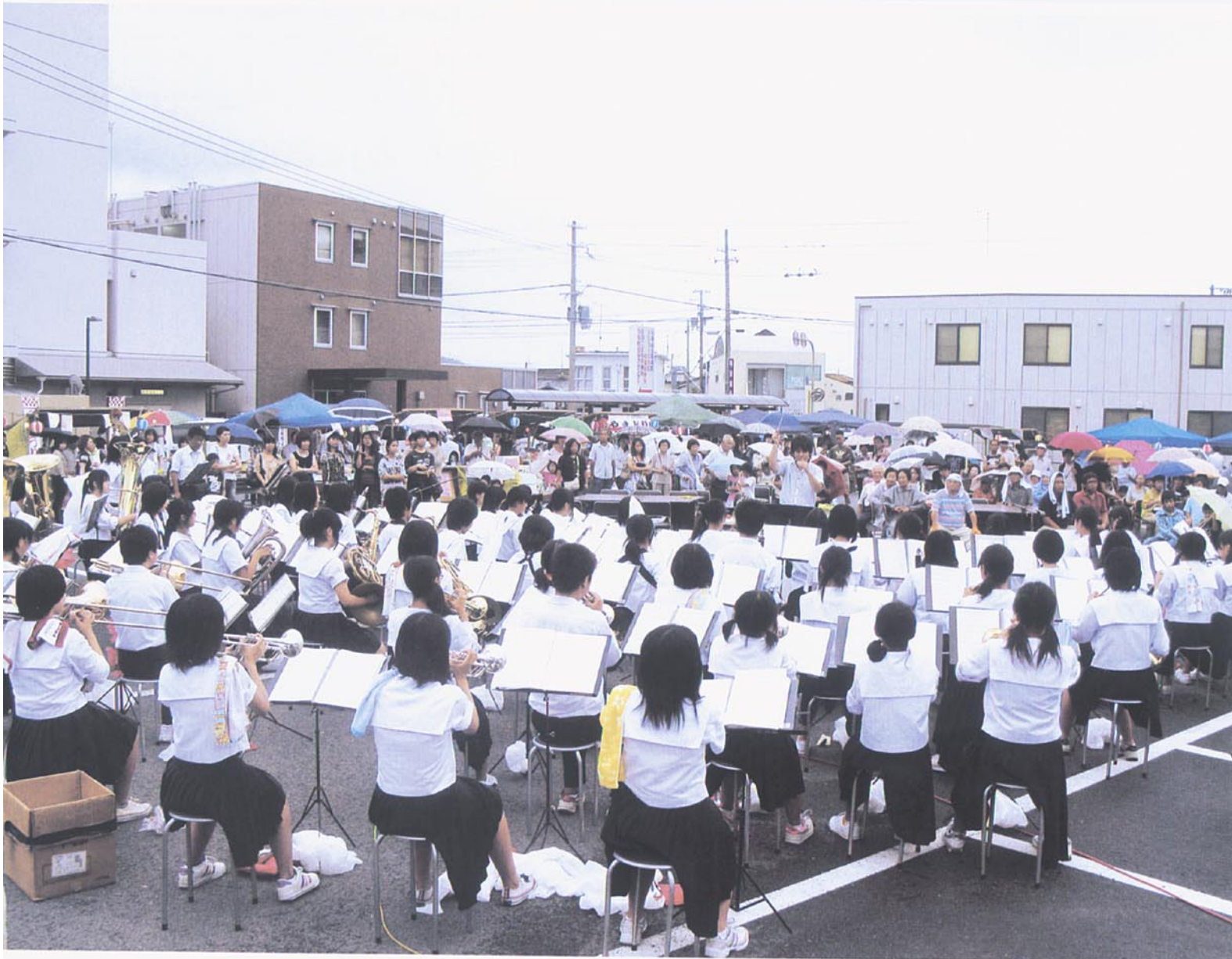
和歌山生協病院開設30周年記念まつりが9月17日（土）病院西駐車場にて開催され、紀之川中学校吹奏楽部のみなさんの軽快な演奏で幕が開きました。