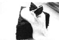
※ 250gの卵黄、150gの卵白、150gの砂糖