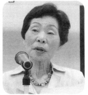
代 山中山支店 海南

班2つを増やして4課題を達成したことと今後班会を楽しく続けていく上での課題について、海南中山総代からは、海南元気市の終了とともに終わった医療生協健康青春チエックでしたが、このとりくみで培った人とのつながりを継続し、安心とやさしさの拠点にしようとは始められたいんき食食会が1年目を迎え、参加者の輪が広がっていることが紹介されました。健康づくり委員会中嶋委員からは健康づくりチャレンジが『ヘルスアップチャレンジ』と名称を変え、中身も19コースに増え魅力倍增、多くの参加を呼びかけました。生協中之島山本事務長より、診療所閉院後の施設を複合型サービス(デイサービスのほかに訪問介護やショートステイ、訪問看護の4つのサービスを受けられる)としてみなさんに喜んで