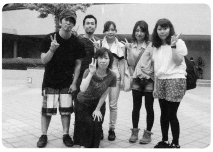
生協病院から6名が参加しました

貴重な話を聞かせて頂き、これだけ核兵器・放射線の影響がわかっているのに、原発再稼働なんてありえないと怒りでいっぱいになりました。