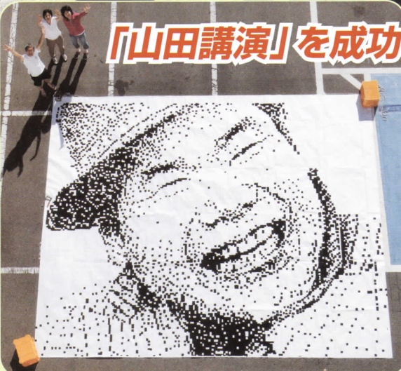
当日の舞台には真さんの巨大なドット絵（7m×6m）が飾られます。完成した絵を生協病院駐車場に並べ屋上から撮影しました。