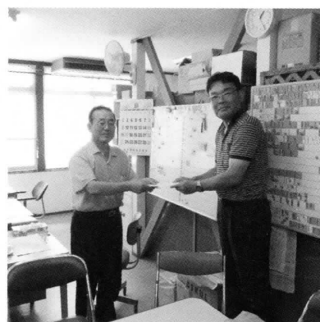
松島医療生協へ見舞金を手渡しました

民本位の復旧・復興を！のシンポジウムがあり、人、住まい、生業の再建の格差が生まれ、遅々として進まない地域、状況が多岐あることが語られました。