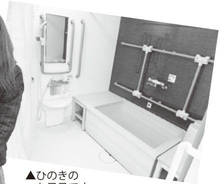
▲ひのきのお風呂です

生協中之島(和歌山市中之島880-2)の1階で、4月1日より「複合型サービス」が始まりました。診療所を閉じて以来、地域の皆さまにはご心配をおかけしてまいりましたが、介護の新しいかたちの事業所として生まれ変わりました。