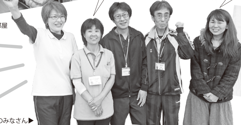
生協中之島のみなさん▶