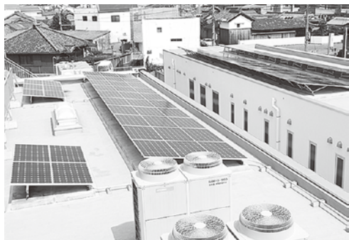
附属診療所屋上に設置された太陽光パネル