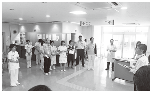
健診の打合せをするスタッフ

ました。健康診断内容は、問診・身体測定・診察・血液検査・尿検査・心電図検査・甲状腺エコー検査で、職員34名がそれぞれの専門性を発揮し任務にあたりました。こどもの不安を和らげるため診察室への飾り付けなどを工夫しました。そして、避難者の健康とくらしの内容を詳細にききながら、初めて来院される避難者家族が健診をスムーズに受けることができるよう終了まで担当者が家族に付き添いました。