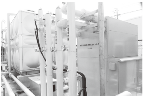
生協病院東側設置のヒートポンプ

自然エネルギーを活用することで少しでも原発に頼らない社会の実現に近づければと思います。