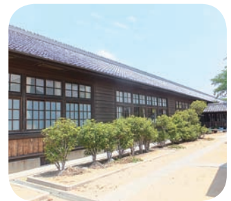
重要文化財の校舎

本「高年齢輝きフェスタ」が行われ、健康チエックを行いました。会場は、木造校舎が国の重要文化財として指定されている高野口小学校。現在も授業に使われており、現役の小学校校舎が指定されるのは二件目だそうです。98メートルの廊下、瓦屋根、木の格子窓、朝の連ドラのロケにも使われるほど、昭和初期の香りのする校舎です。「輝きフ