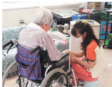
理学療法士さんが優しくマッサージ

老健施設は、医療機関を退院後、「介護を必要とする高齢者の自立を支援し、家庭への復帰を目指すために、医師による医学的管理の下、看護・介護といったケアの他、リハビリテーション、食事、入浴などの日常サービスまで併せて提供する施設」という趣旨で、1988年に制度ができました。しかし現在、「在宅復帰型老健」は全国約4000施設のうち5%程度、和歌山県では2施設のみであり、大多数は「長期入所型老健」となっています。老健施設では3か月の個別リハビリを行うことができず、家庭に高齢者を介護する力がないため、リハビリだけでは高齢者の多くは家に帰れないのです。特別養護老人ホ