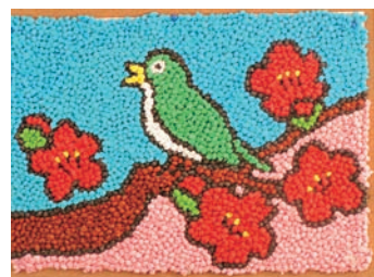
こんな素敵な作品も

取り入れようと努力しています。入浴は「肩までゆっくりに湯船につかる」ことにごだわっています。またオムツではなく、トイレで排泄できるようにしています。そうした場合、松寿苑に来る前には常時オムツを着用し、機械浴で入浴されていた方の機能が向上する例も多くあります。食事は特にそれぞれの好きなものを食べてもらえるよう工夫しています。老健施設の運営は、現実にはすぐわれない法的制約が多いのですが、その中で可能な限り入所者の方が自分らしい生活ができるよう、職員34名で苦心しているところ