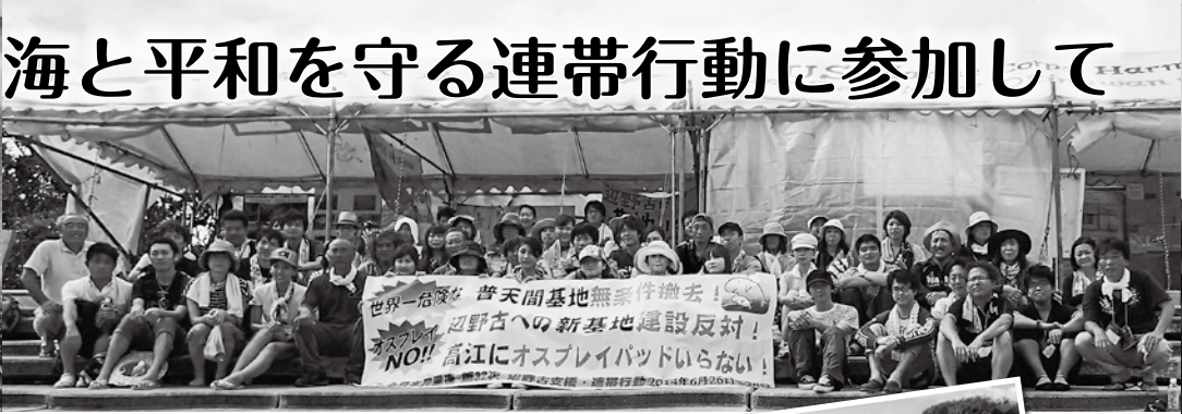
基地建設を阻止するための座り込み