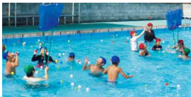
プールでの楽しい水中玉入れ

お問い合わせやご紹介は、和歌山県民医連・医学生担当 (TEL 441-5090) まで、気軽にお声をかけてください。