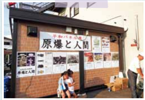
生協中之島 7月26日、300人参加。原爆のパネル展も