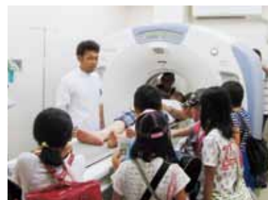
CTスキャンの説明を受けるこどもたち

運営は、こども診療所スタッフだけでなく、医学生・看護学生も一体となって取り組みました。今年のデイキャンプにも和歌山県立医大から医学生が参加し、こどもたちと一緒に学び遊びました。医学生の『お兄ちゃん』にこどもたちも大喜びで、特にプール遊びのときはこどもたちに囲まれて大忙しの活躍ぶりでした。