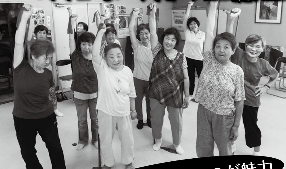
セラバンドで決めポーズ