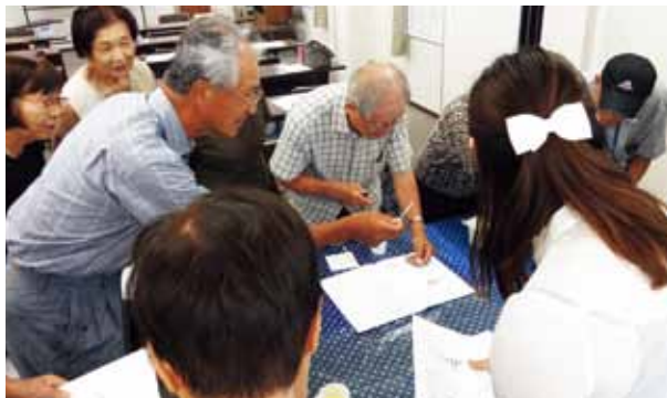
尿検査試験紙の色を真剣にチェック

7月29日(火)に東中地区では、健康チェックサポーター養成講座が開かれました。自分たちの健康を自分たちで守るため、健康チェックの方法や生活習慣と病気の関連性などを学習しました。血圧を実際に測ったり、尿検査の試験紙を自分で判定したり、身長と体重からBMIを計算してみたりしました。参加された組合員からは「肥満と食べるのが早いのは関係があるのか」「今度は支部の方へも来てほしい」など質問や要望があり、13名と少人数でしたが、わいわいと楽しく学習できました。病気の最大の治療法は予防です。病気になる前に健康チェックをして、自分たちの健康は自分たちで守れるよう、今後も健康チェックサポーター養成に取り組んでいきます。