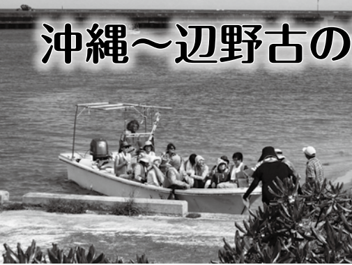
海上調査に乗り出す