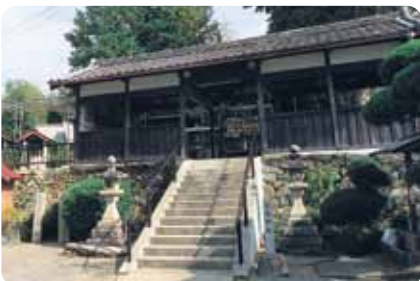
足守神社(和歌山電鉄貴志川線山東駅下車 北へ500m)

和歌山電鉄貴志川線の山東駅から北へ徒歩10分、木枕地区に足の神さん、900年の歴史をもつ足守神社がある。諸国行脚中の覚 かま 上人が、灌用水池を作る際、工事で足を痛めた農民のために建てられたことが起源と言われている。足痛平癒を始め、足に関わる様々な願い事やその成就へのお礼を書いた絵馬、わらじが奉納されていて、小さな神社だがいかにも人に優しい神が住んでいるような雰囲気だ。