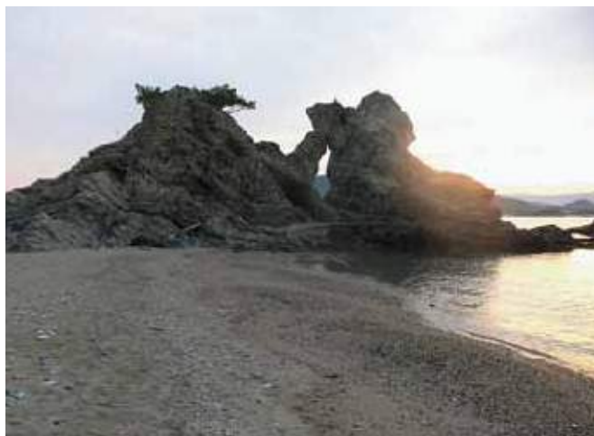
蓬莱岩 (羊の姿にも見えませんが…)