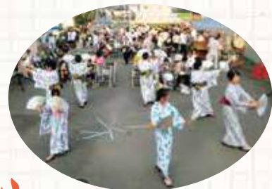
盆踊りや のど自慢大会も 800人が来場