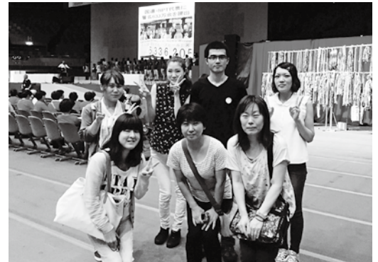
今年の原水禁世界大会には、医師、看護師、検査技師、介護士(特養ホームわかばから1名含む)の7名が参加し、貴重な経験と学びを得ることができました。皆様よりカンパやご支援をいただき、有難うございました。