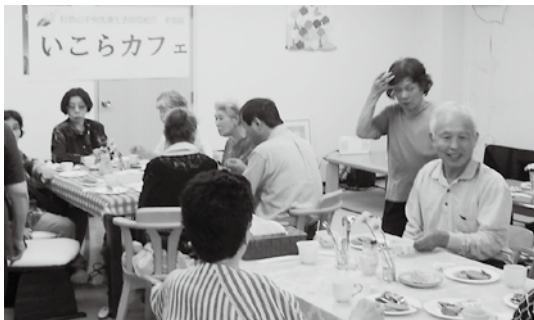
「いこらカフェ」…地域の皆さんとの交流をめざして中之島いこら会館で開きました。定期的に行いたいと思っています。

マップをもとに、これからつながりたい組織や人とはどのようにしたらつながりができるかを話し合い、行動を起こします。こうして実際につながりをつくっていくことができれば地域に強力な支え合いのネットワークを生み出すことができます。