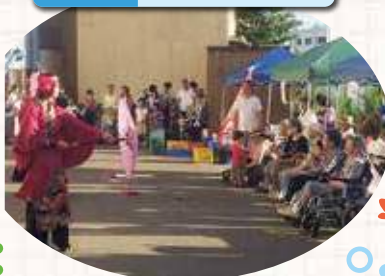
踊りに見入る参加者