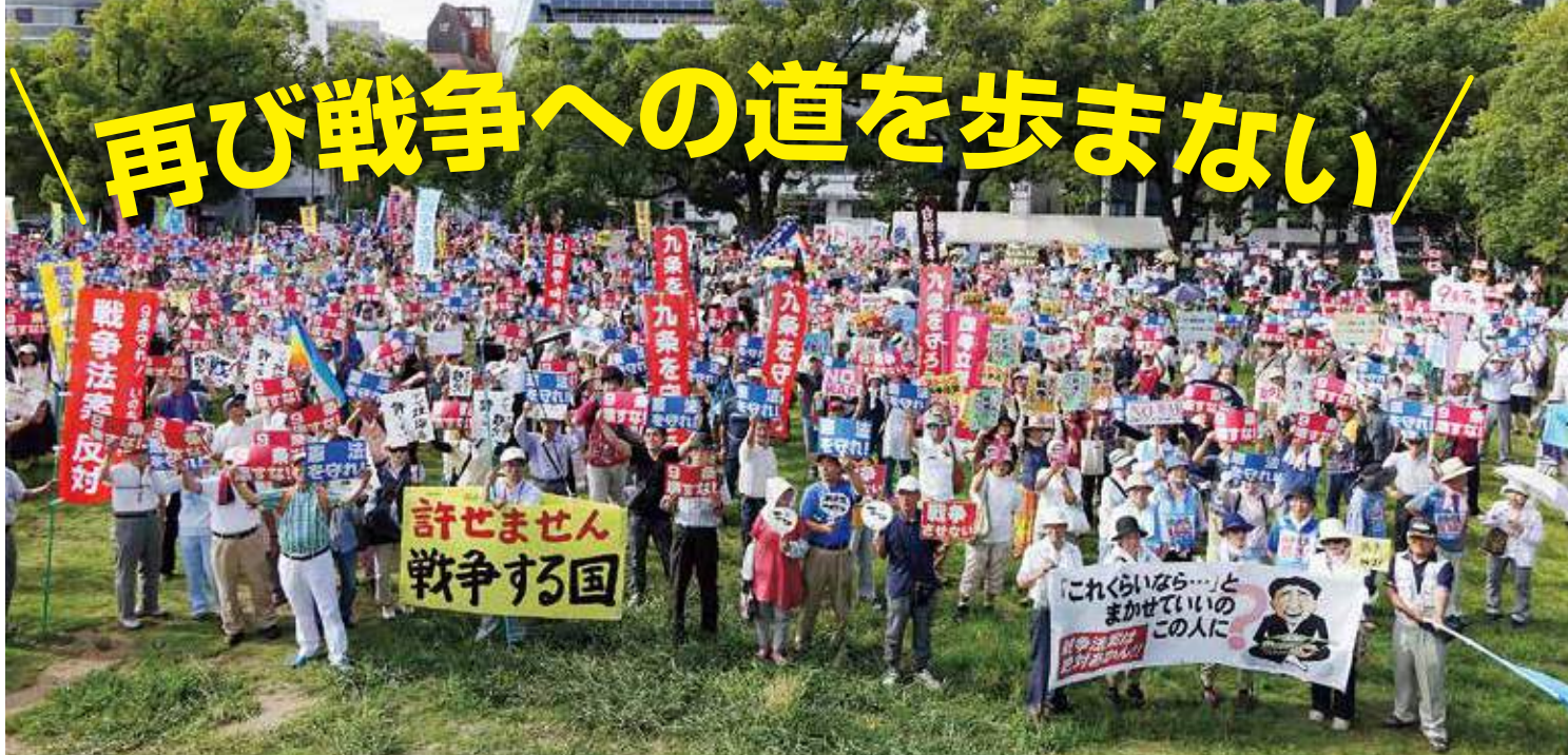
7月12日、和歌山城西の丸広場にて。安保法案(=戦争法案)反対を訴える人々が約2,500人集結。