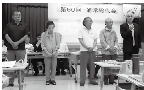
今期で退任される役員のみなさん