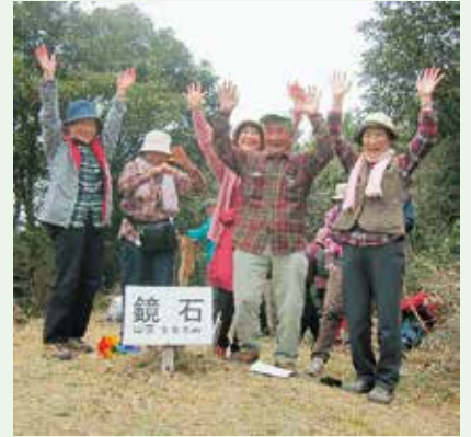
▲山頂で米寿のお祝い