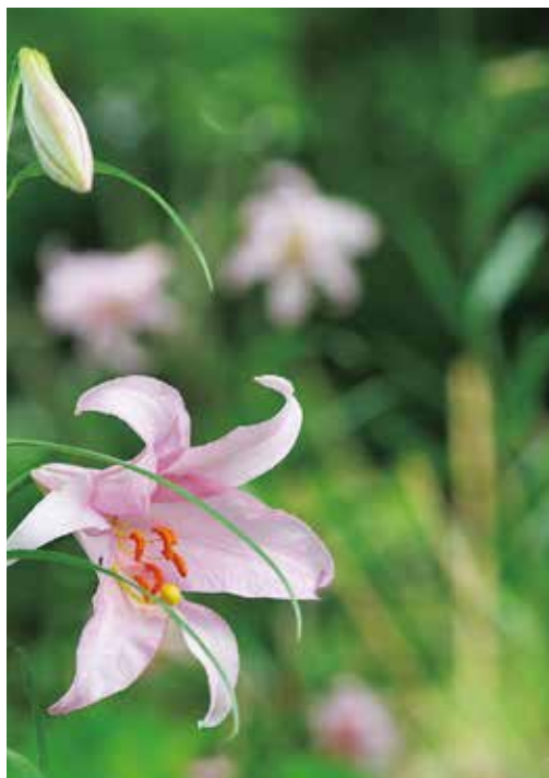
写真と文 / 甲佐 洋三さん(那賀地区・岩出)