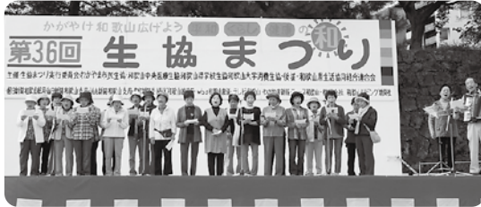
▲東中地区 童謡を唄う会