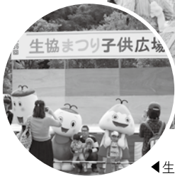
▲生協まつり子供広場