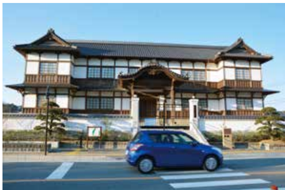
旧和歌山県議会議事堂(一乗閣)