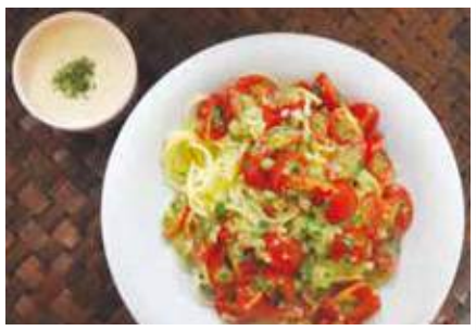
〈一人あたり〉 エネルギー 455kcal 塩分 5.3g

このスパゲティのトマトは、味の濃いプチトマトがおすすめです。塩を加えて水分が出るまで、ちょっと待ちましょう。トマトから出た水分が、おいしいソースになります。