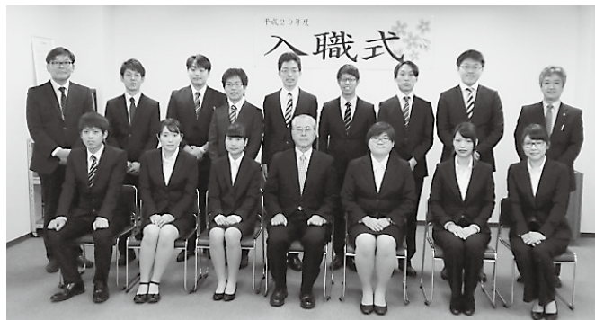
看護師5名、臨床工学技士1名、セラピスト4名、事務2名、ケアワーカー1名

人間や医師としてまだまだ至らない面も多いかとは存じますが、医師になった頃より丁寧な診察と説明をこころがけています。どうかよろしくお願ひいたします。