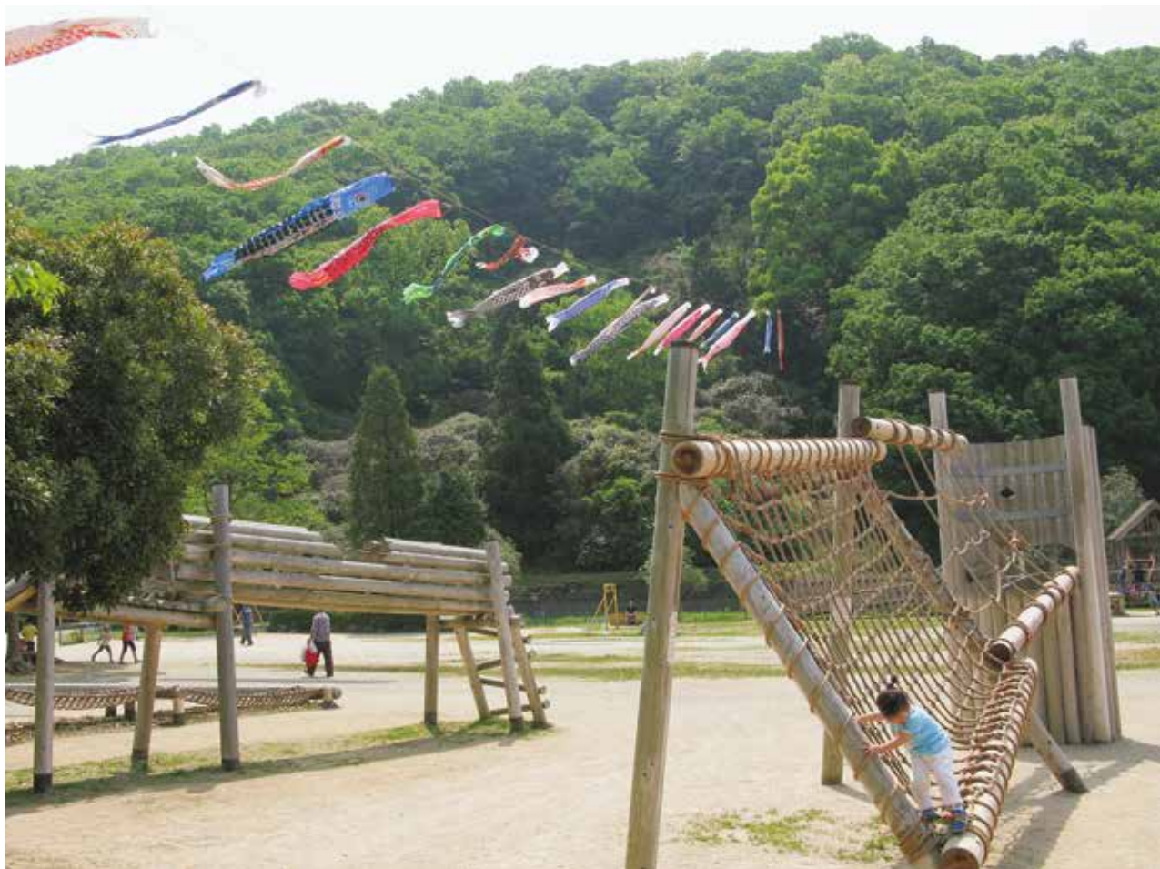
緑花センターわんぱく広場

発行 ● 和歌山中央医療生活協同組合 〒640-8390 和歌山市有本138-14 ☎073-474-5121 FAX.073-475-4288 ホームページ http://www.w-iryoseikyoo.com/ 編集 ● 機関紙委員会