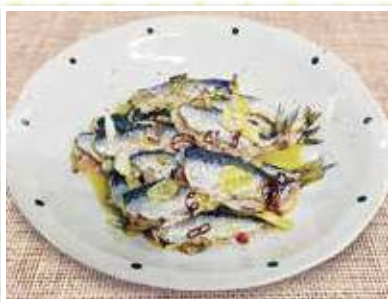
(一人あたり) エネルギー 200kcal 塩分 0.15g