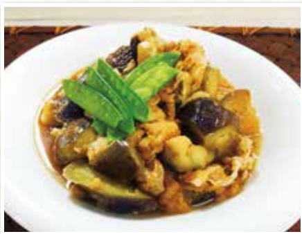
〈一人分〉エネルギー 396kcal 塩分 0.85g