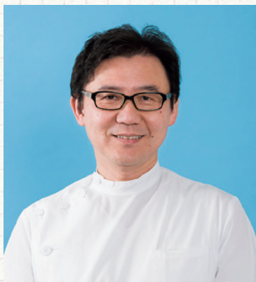
和歌山生協病院 内科部長

医師の仕事は、外来の診察、病棟受け持ち患者の診察、急患対応、患者さんへの病状説明、各種の診断書の作成、職場会議、症例検討など多岐にわたります。厚労省の調査によると、医師の労働時間は週平均56時間、40%の医師が60時間以上です。つまり、医師の40%が月80時間以上の時間外労働を行っていると言えます。月80時間を超える残業は、過労死ラインとされています。ちなみに、今週の私の時間外労働時間は、毎日4時間で週20時間、当直の拘束を含めると週32時間です。これでも患者さんとゆっくりと向き合う時間が取れないのが現状です。